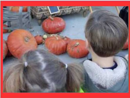
op bezoek bij