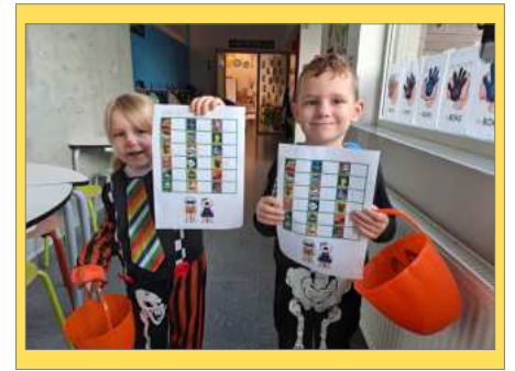
hoekenwerk Halloween in L1