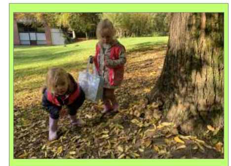
en met 3e kleuter, L1 en L2 naar de Gavers