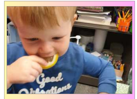
Speurneus op avontuur in Peuterklas (zintuigen)