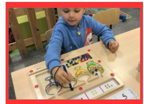
Seizoenenspeeltijd in K2