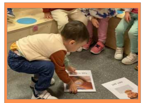
Lieve oma, best opa. De postbode is daar K1