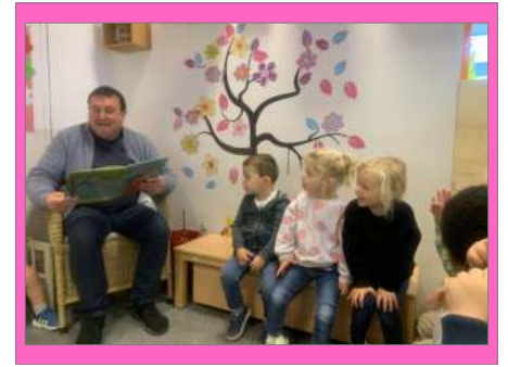
onze grootouders kwamen voorlezen in K1