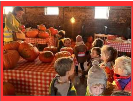
De Drie Linden