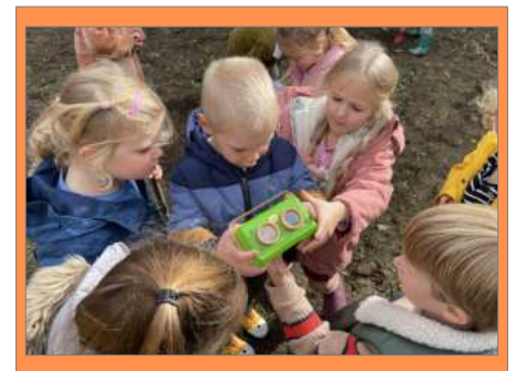
Kriebels, beestjes en blaadjes in K3