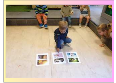
Speurneus op avontuur in Peuterklas (zintuigen)