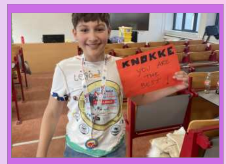
deelname L5 en L6 @ first lego league