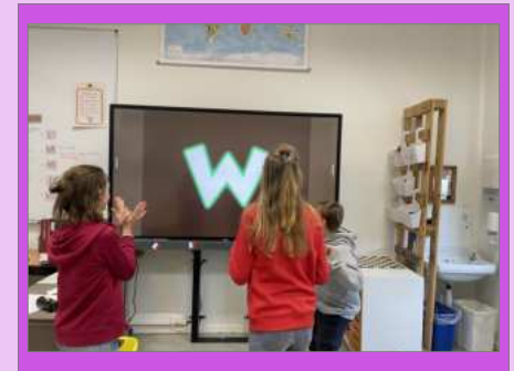
Franse dag 6de leerjaar