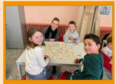
3e kleuter - 1e leerjaar - dag